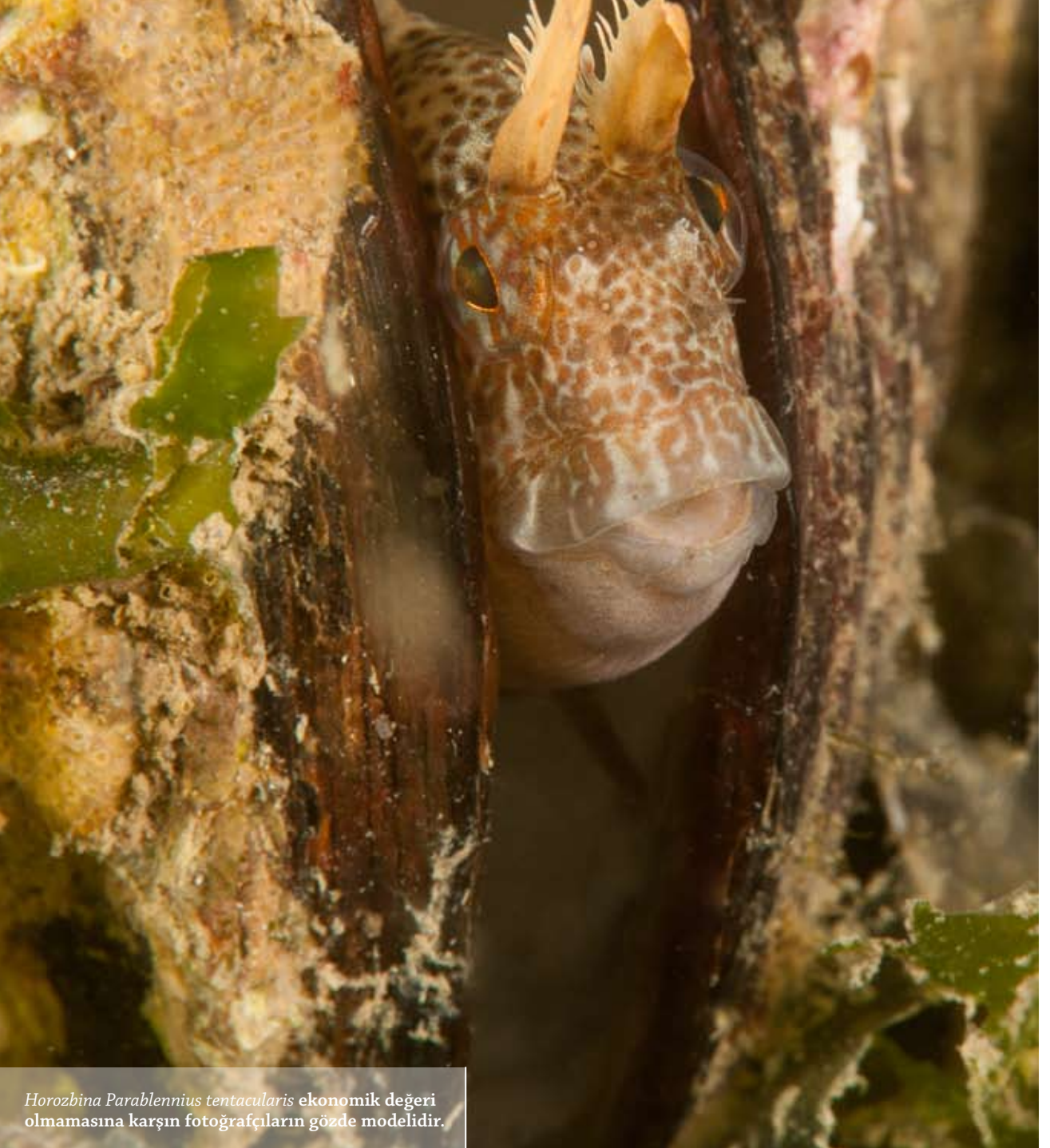
Horozbina Parablennius tentacularis ekonomik deęeri olmamasına karřın fotografçıların gözde modelidir.