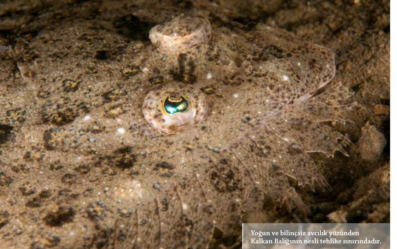
Yoğun ve bilinçsiz avcılık yüzünden Kalkan Balığının nesli tehlike sınırındadır.

Peki beni tekrardan İzmit Körfezi'ne ve Değirmendere'ye aşık eden nedir? Bunu düşünmeye gerek yok aslında. Yaşarken görüyorsunuz. Kocaeli Büyük Şehir Belediyesi ve Körfez'deki belediyelerin yaptığı arıtma tesisleri ile havadan ve karadan taviz verilmeden yapılan kontrollerin yanında Sahil Güvenlik Komutanlığının bölgedeki gücü TCSG-10'un faaliyetleri size bunun cevabını net olarak veriyor.