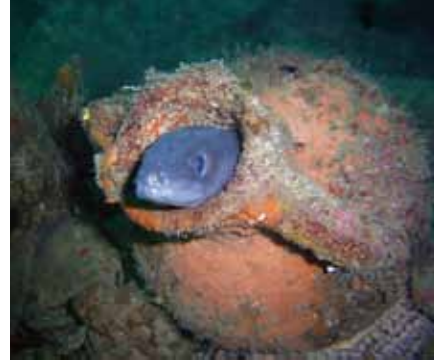
Çanakkale Çam Burnu, Miğri ( Conger conger )

Çanakkale Boğazı, farklı ekosistemiyle dalış severler için her zaman ayrı bir cazibe noktasıdır. Diplerdeki geçmişin mirası batıklar ve soğuk yüzey suları ile daha sıcak olan dip sularının buluşma havzası, beraberinde sürekli farklılaşan ve devamlı heyecan uyandıran fauna ve flora olarak zengin popülasyonlar yaratır. Çam Burnu, kıydan başlayıp derinliklere doğru inilebilen en güzel dalış noktalarından biridir. Diplerdeki batık ve batığı mesken tutan deniz canlıları, geniş açılı ve makro görüntülerde avantaj sunar. 16-17 metrelerdeki sıcak/soğuk su tabakası Raja clavata ve Dasyatis pastinaca türü vatozların dansına sahne olur.