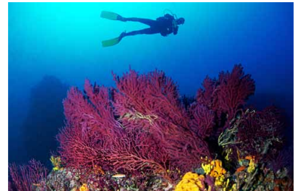
Ayvalık Tokmaklar, kırmızı mercan, gorgonya