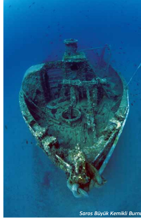
Saros Büyük Kemikli Burnu