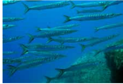
Bodrum Kargı Adası, baraküdalar