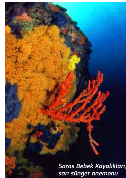
Saros Bebek Kayalıkları, sarı sünger anemonu

Kabatepe İskelesi’nden hareketle 9 millik bir süratle bir saat sonra Bebek Kayalıkları’na ulaşabilirsiniz. Mitolojik bir efsaneye göre; bu noktanın karasal bölümünde Agospatami adıyla bilinen antik bir şehir varmış. Agospatami ‘altın post’ anlamına gelmiş ve bu kent için çok özel bir önemi varmış. Altın postu giyebilen, ölümsüzlüğe ulaşmış. Bu nedenle de şehir, sürekli korsanların