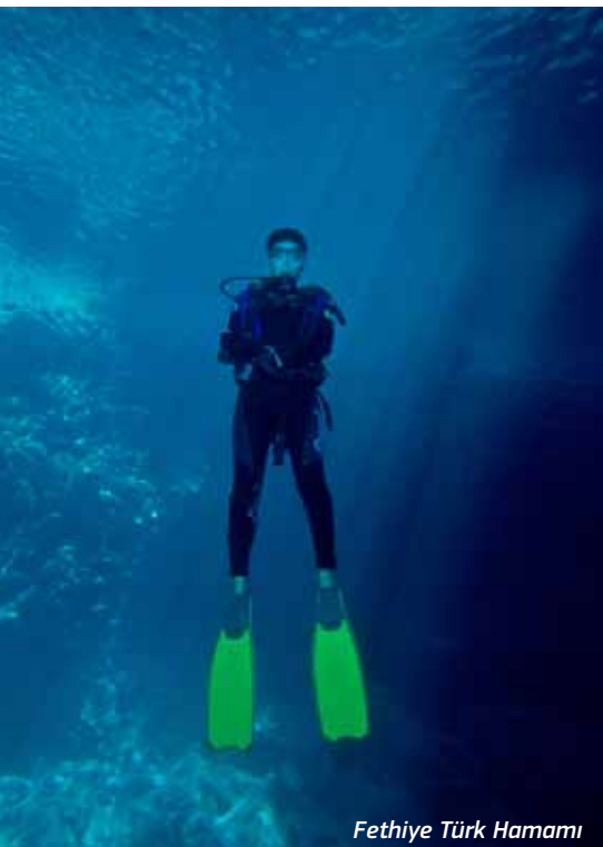
Fethiye Türk Hamamı