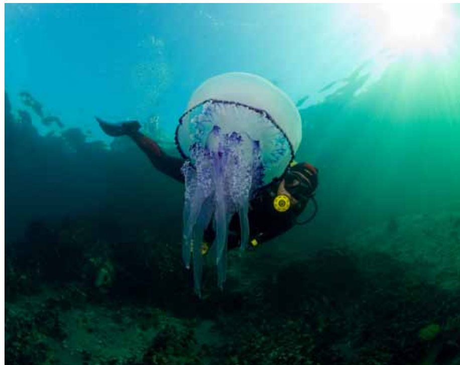
Çanakkale Çam Burnu denizanası ( Rhizostoma pulmu9 )