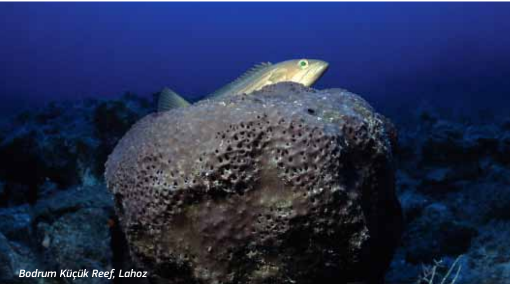
Bodrum Küçük Reef, Lahoz