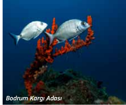
Bodrum Kargı Adası

Ege'nin balık popülasyonu açısından en zengin dalış noktalarından biridir. İzmarit, küpes ve baraküda sürüleri sıralı olarak aynı hiyerarşik yapı içinde dalışçıları karşılar. Bentik alandaki tüplü formlar ( Sabella pavonina ) dip yapısına ayrı bir muhteşemlik katar. Dalış noktasına Bodrum'dan hareketle bir saatte gidilebilir.