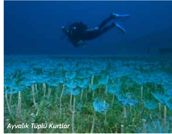
Ayvalık Tüplü Kurtlar

kırmızı mercanların ( Paramuricea clavata ) en bol bulunduğu ve tahribata uğramadığı dalış noktalarından biridir. Denebilir ki, en uzak dalış noktasıdır. Kuzeydoğusunda bir başka sığlık, Kербela bulunur. Derinliği günümüz sportif dalış sınırlarında olmasına karşın bu noktalara ‘sığlık’ denmesi süngercilerden bizlere kalan bir mirastır.