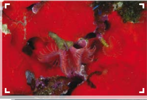
Boru kurdu ( Serpula vermicularis ) sünger ile birlikte makro kadrajda güzel bir görüntü oluşturuyor.