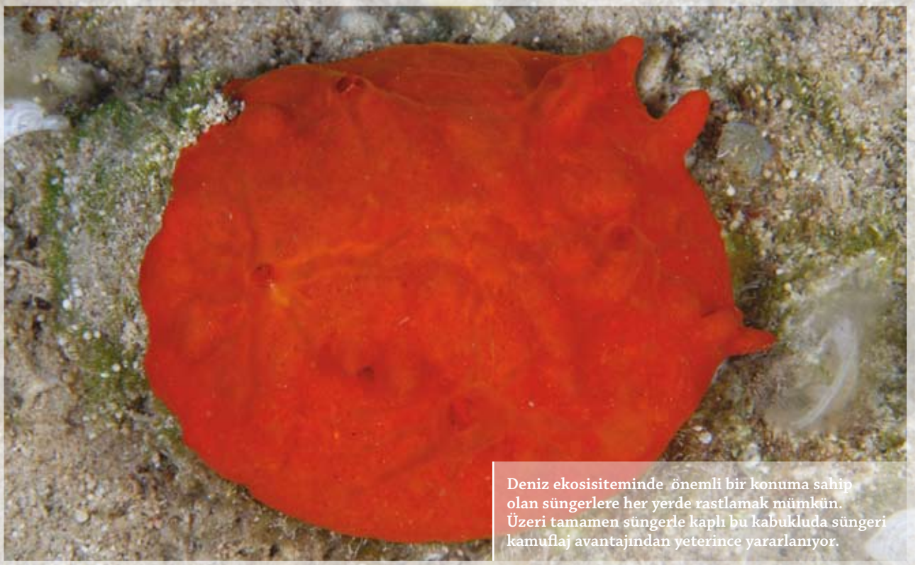
Deniz ekosisteminde önemli bir konuma sahip olan süngerlere her yerde rastlamak mümkün. Üzeri tamamen süngerle kaplı bu kabukluda süngeri kamufraj avantajından yeterince yararlanıyor.

Deniz ekosistemlerinin yaşayan 5000'den fazla türün yanı sıra 150 kadar su formu barındıran süngerler bireysel veya koloniler halinde yaşarlar. Genel kanaatin aksine tüm denizlerde ve tüm derinliklerde yaşayabilen süngerlere aşırı tuzlu sularda bile rastlamak mümkün, larva hali serbestçe yüzme yetisine sahip olan süngerlerin ergin formları bir kayaya, kabuğa, mercana veya suya batmış herhangi bir yüzeye (batıklar gibi) tutunarak