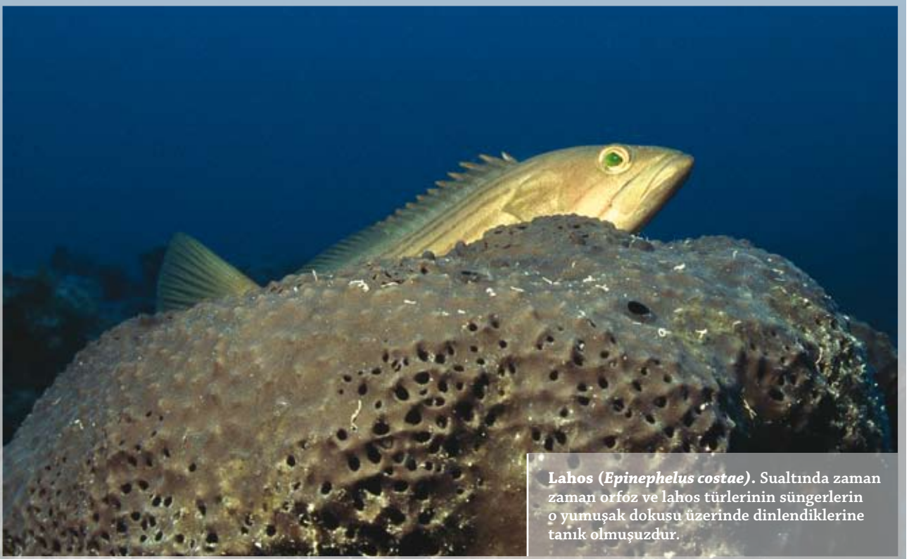
Lahos ( Epinephelus costae ) . Sualtında zaman zaman orföz ve lahos türlerinin süngerlerin o yumuşak dokusu üzerinde dinlendiklerine tanık olmuşuzdur.

Günümüzde birçok değişik formu bulunduran altı sünger türü ekonomik değere sahiptir. Bu süngerler sert iskelet elementlerini içermezler. Akdeniz süngerleri en yumuşak ve en kaliteli olanlarıdır. Ve artık nesli tehlike altında olup, avcılığı yasaklanmıştır. Yasaklamada 1985 yılında yaşanan ve "sünger vebası" olarak da adlandırılan hastalığın büyük etkisi olmuştur. Yok olma sınırındaki sünger, beraberinde süngerciliğin de sonunu getirmiştir. Rengarenk tirhandil süngerci teknelerimiz de, ilkbaharın gelişiyile başlayan o tatlı telaş da yoktur