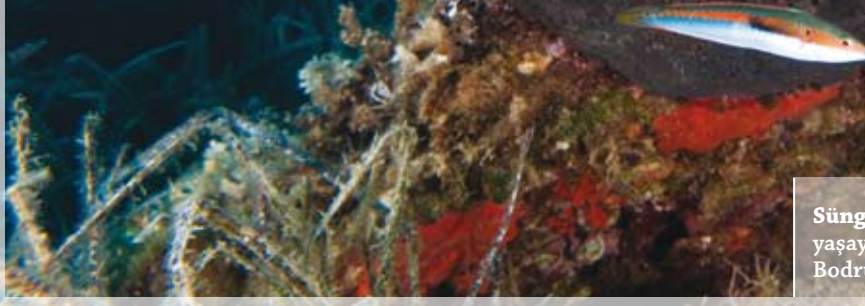
Sünger ( Sarcotragus foetidus ) ve üzerinde yaşayan saçaklı yıldız görüntümüz Bodrum'un derinliklerinde kaydedildi.

yaşamını sürdürür. Bazı dip formları deniz tabanında veya balçıkta bile yaşayabilir.