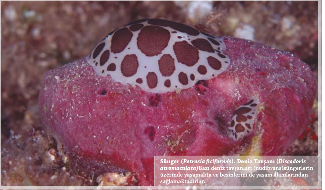
Sünger ( Petrosia ficiformis ). Deniz Tavşanı ( Discodoris atromaculata ) Bazı deniz tavşanları (nudibrans) süngerlerin üzerinde yaşamakta ve besinlerini de yaşam alanlarından sağlamaktadırlar.

edemezmiydi? Daha büyük bir vücuda sahip olabilmek için yeryüzündeki yaşamın çok hücreli bir organizasyona yöneldiğini tahmin etmemiz akla oldukça yatkın geliyor. Milyonlarca yıllık bir süre ve asla emin olamayacağımız çok değişik koşullar ilk çok hücrelilerin oluşması için gerekli ortamı sağlamış olmalı. Bundan sonrası için ise mantık yürütmek o kadar zor değil. Belli işleri paylaşan bir topluluk oluşturmuş bu hücreler, şüphesiz büyük bir avantaja sahip olacaklardı ve böylece sayıları da zamanla arttı. Zaten daha büyük bir vücuda sahip olabilmek için bir tek hücrenin büyümesi yeterli değildi, çünkü hücrenin metabolik aktivitelerini yürütebilmesi için gerekli olan yüzey-hacim oranı bu şekilde oldukça bozulmuş oluyordu. Büyük bir vücut için yalnızca tek bir çözüm vardı; çok hücrelilik. Süngerler aslında belirgin bir farklılaşmaya (bizim vücudumuzdaki hücreler gibi) uğramamış hücrelerin bir araya gelmesi ile oluşan bir hücre kütleli olarak da anlatılabilir. Bu sadece süngerlerin vücut organizasyonunun, evrimin ilerleyen aşamalarındaki diğer hayvanlarla kıyaslandığında ne kadar basit kaldığını anlatmak amacıyla kullanılan süngerler, çok değerli bilgilerin elde edilmesine yardımcı olmuşlardır. Bu deneylerden birinde farklı renklere sahip iki sünger hücrelerine kadar parçalanıp aynı ortam içerisinde karıştırılmışlardır. Belli bir süre sonra her iki süngerin de kendi hücreleri tarafından, tekrar oluşturulduğu gözlemlenmiş! Bu deney,